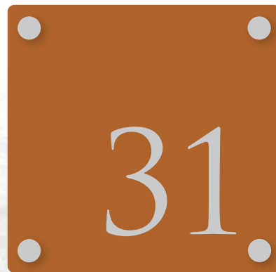
Over: Alternativ uten navn