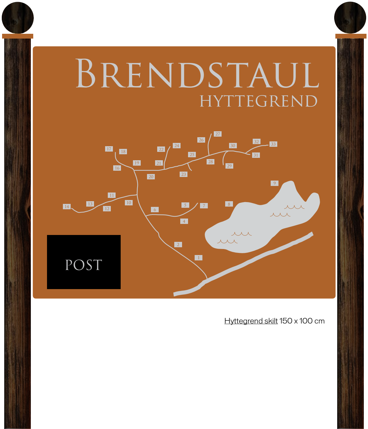
Hyttegrend skilt 150 x 100 cm