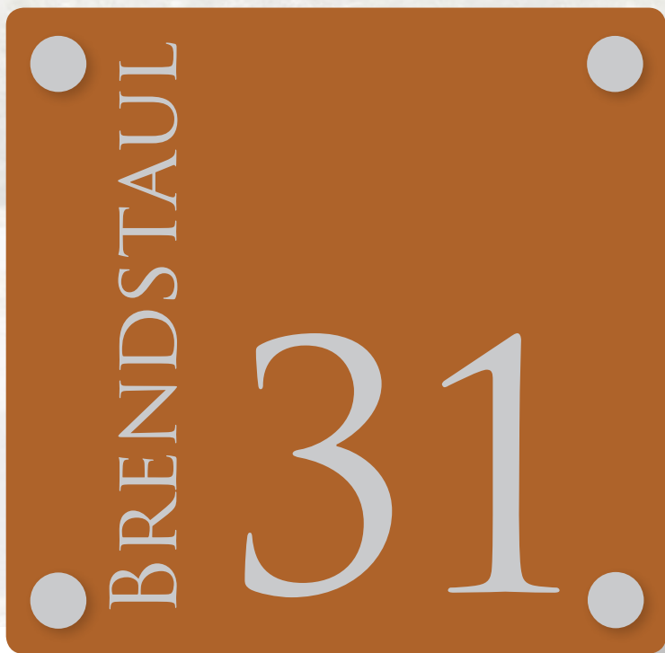
Hytteskilt 15 x 15 cm