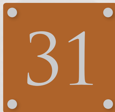
Under: Alternativ sentrert med feste under