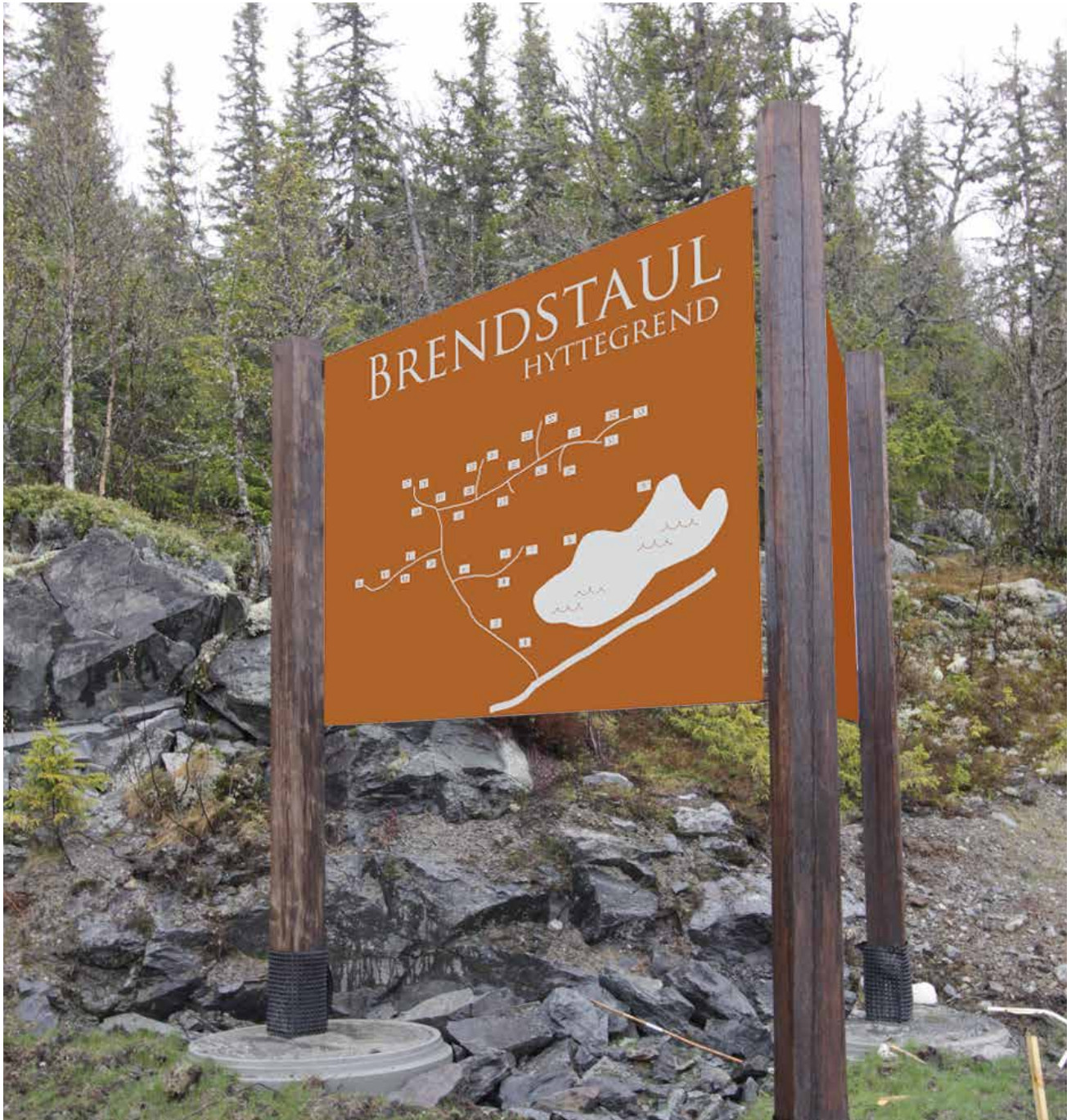
Hyttegrend, enkelt trestativ skilt 150 x 100 cm