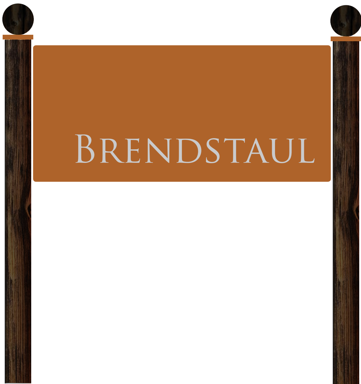
Stølskilt 120 x 50 cm